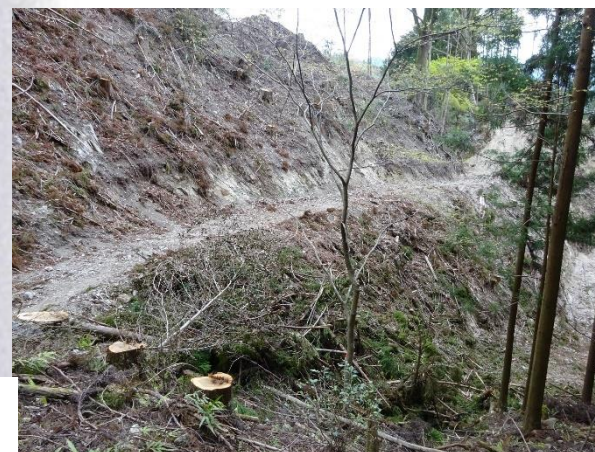
②木材切出し作業区間 足元及び重機に要注意！

◆奥津(おきつ)地区から飼坂峠を多気(たげ)地区へ向かって越えていくと、木材の切り出し作業区間と合流します。この作業は、 令和4年3月31日まで 三重県の許可を得て行われています。通行の際は十分にご注意ください。