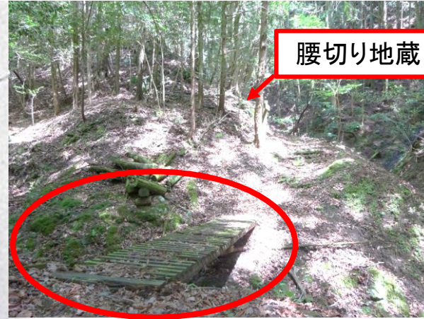
①渡り橋 足元要注意！

◆「腰切り地蔵」の手前の渡り橋の痛みが激しく、修繕予定です。通行の際は足元に十分ご注意ください。