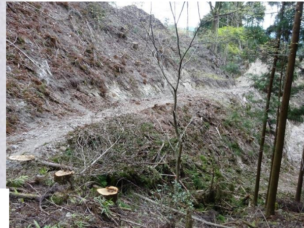
②木材切出し作業区間 足元及び重機に要注意！

◆奥津(おきつ)地区から飼坂峠を多気(たげ)地区へ向かって越えていくと、木材の切り出し作業区間と合流します。この作業は、令和4年3月31日まで三重県の許可を得て行われています。通行の際は十分にご注意ください。